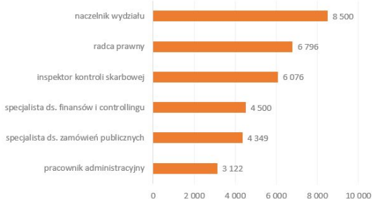
Wykres 3. Mediany wynagrodzeń na wybranych stanowiskach administracji publicznej w 2017 roku (brutto w PLN)

Źródło: Raport Wynagrodzenia w administracji publicznej w 2017 roku, Sedlak & Sedlak