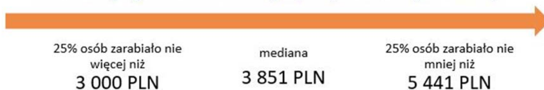
Schemat 1. Wynagrodzenia w administracji rządowej w 2017 roku (brutto w PLN)